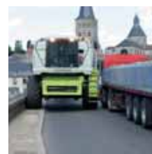
Difficulté de croisement