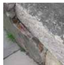
Éclatement de pierres