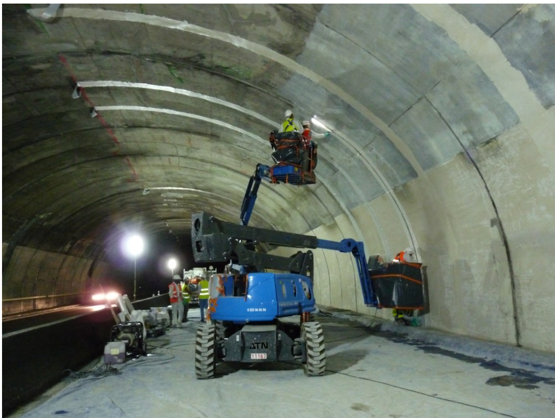
Traitement des joints de plots

Les travaux concernant la réparation de la section nord du tunnel, sens Lyon vers St Etienne, se sont terminés comme prévu le 22 août 2015, malgré les difficultés subies sur le chantier du fait des fortes chaleurs du mois de juillet.