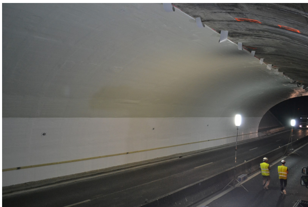
Vue de la section nord réparée du tunnel